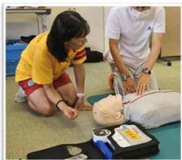
人形を使用した心肺蘇生