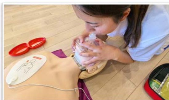
レサシテーションマスクを 使用した人工呼吸