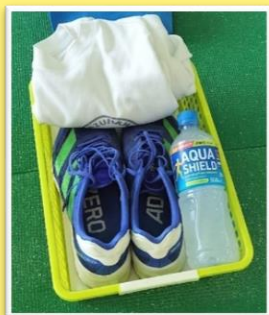
例) トランジション準備